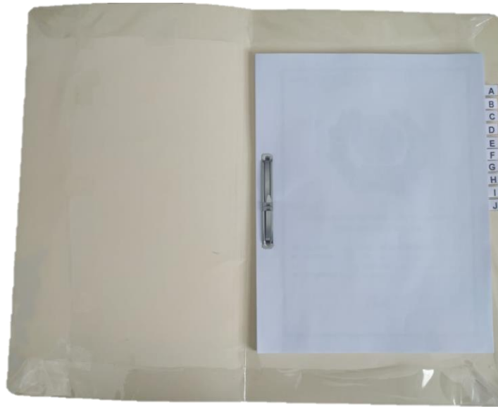
HOJA BLANCA (HOJA DE RESPETO)