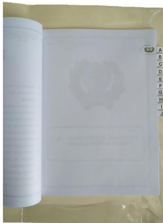
PESTAÑA EN HOJA BLANCA